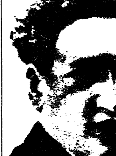
سيد درويش والقلم تحمي

تقول كريستين: «الحقيقة ان مشاهد تعري غير لاذن ان يكون هناك شيء خاطيء».